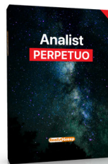
ANALIST LICENZA PERPETUA