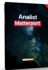
ANALISTMATTERPORT SUB 1 ANNO