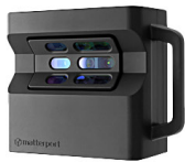
CAMERA PRO2 3D

Il rilievo dello stato di fatto delle facciate e la redazione del computo metrico per il Superbonus.